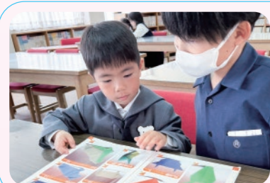
小学校の学校探検