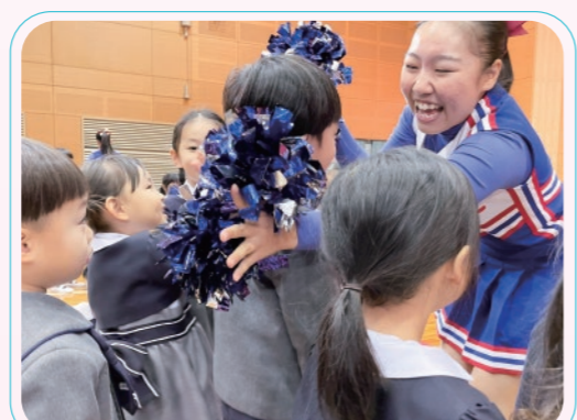
中学・高等学校の生徒との交流