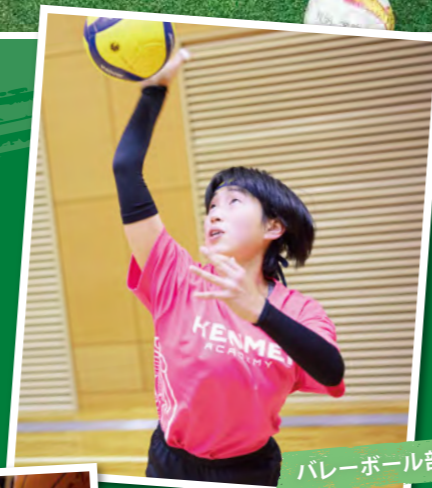
バレーボール部(女子)