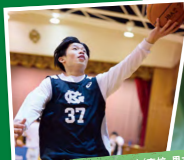
バスケットボール部(中学女子)(高校・男女)