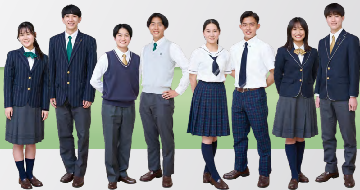
正制服 ※女子はスラックススタイルも選べます